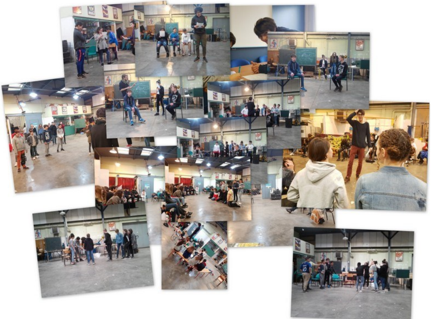
Le projet théâtral avec la Compagnie Bonne Chance